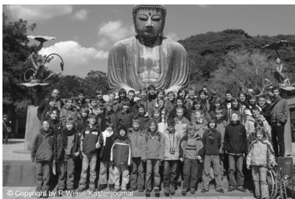
Der Thomanerchor bei seinem Ausflug in die Tempelstadt Kamakura am Pazifik

Neun umjubelte Konzerte mit Bachs Matthäus-Passion bzw. der h-Moll-Messe gab der Thomanerchor in Südkorea und Japan, hinzu kam ein A-cappella-Konzert in Seoul. Die höchst erfolgreiche Tournee, zusammen mit Solisten und dem Gewandhausorchester, brachte eine neue Einladung nach Asien im Jubiläumsjahr 2012.